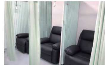
経過観察スペース