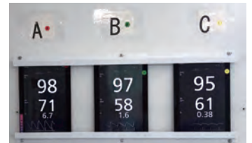
遠隔無線モニタリング