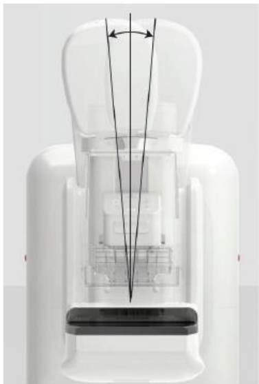
キャノンメディカルシステムズ製 乳房X線撮影装置

通常の2Dマンモグラフィでは、病変と周囲の正常組織や乳腺と重なってしまう問題がありましたが、 3Dマンモグラフィ では、周囲の組織や重なりを減少させる事ができ、従来では難しいとされていた 微小な病変 も発見しやすくなりました。