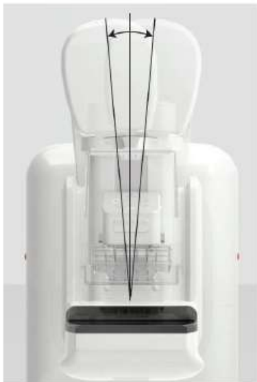
キャノンメディカルシステムズ製 乳房X線撮影装置

通常の2Dマンモグラフィでは、病変と周囲の正常組織や乳腺と重なってしまう問題がありましたが、 3Dマンモグラフィ では、周囲の組織や重なりを減少させる事ができ、従来では難しいとされていた 微小な病変 も発見しやすくなりました。